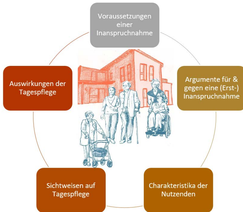
Abbildung 2: Nutzende und Angehörige im Kontext der Tagespflege. Illustration: Serafima Rayskina, © FH Bielefeld, eigene Darstellung

Neben den strukturellen Aspekten der Tagespflege lag der Fokus der Literaturrecherche darauf, Erkenntnisse über Nutzende teilstationärer Versorgung sowie deren Angehörige zu gewinnen. Ziel war es, Informationen aus der Literatur über (I) die Voraussetzungen einer Inanspruchnahme von Tagespflege, (II) die Gründe für eine Inanspruchnahme bzw. Nicht-Inanspruchnahme, (III) Charakteristika der Nutzenden, (IV) die Sichtweise auf die Tagespflege und (V) den Auswirkungen der Tagespflege auf Nutzende und Angehörige zu gewinnen ( Abb. 2 ).